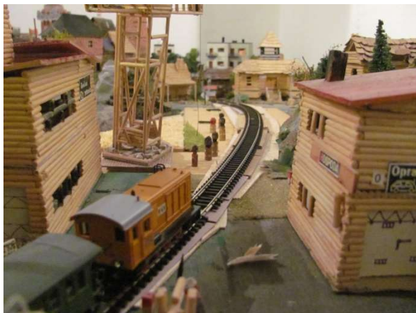
Vlak projíždí směrem k předměstí Gondoly - Elizabeth

Ano, tato velkolepá událost pohnula světem. Přesto tyto seizmické otřesy nikoho neohrozily. Kontinentální desky se pouze s mírnou vibrací k sobě přiblížily a propojily nejenom větrnickou Gondolu s iilandem, ale spojily železnici i Juliánov a Adamov. Přes ně nyní projíždějí vlaky, které zajíždějí i do podzemí metra – do železniční stanice 10. prachopadu, která byla kvůli lepší orientaci přejmenována na stanici Gondola – city. Starší název ponese ulice nad touto stanicí.