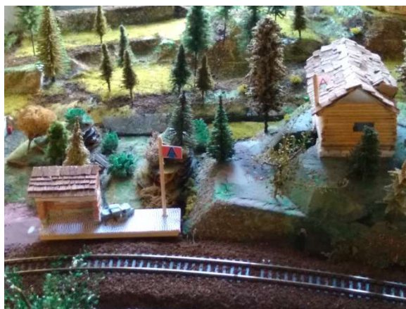
Nová železniční zastávka v Nepálu (AD)

muzejní expozice, nikoli přímo na území iilandu.