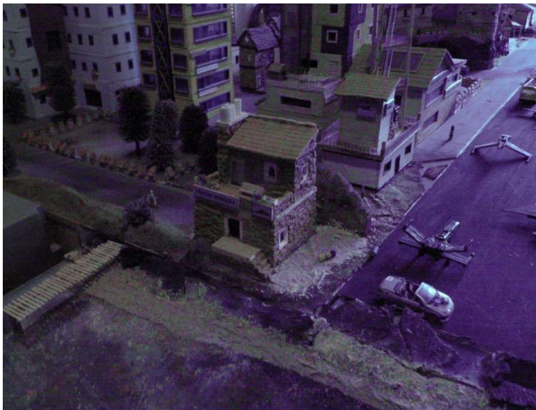
Noční Gondola s letištěm a mořským pobřežím

Na druhé straně letiště je tzv. Jeronýmův pahorek a za ním vede jediná dálnice v iilandu z Juliánova do Gondoly.