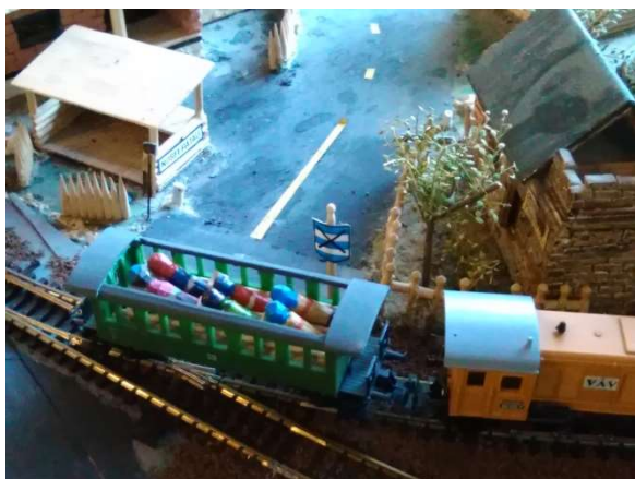
„Agenti“ krouží po železnici

Prezident VU Sharl Shaplin se nedávno vyjádřil v tom smyslu, že Skogomadra si svým významem a historickou úlohou zaslouží, aby jí země iilandu vyšly vstříc a umožnili ji podíl na politickém vývoji iilandu. Co se týče Langary, tady je vláda VU poněkud zdrženlivější. Langara sice hodně přispěla světovému vývoji prostřednictvím vývoje fotbalu a vodních sportů, zároveň je to však veliký provokatér. Naproti tomu vyjádřil Sharl Shaplin poděkování Skogomadře ze poskytnutí dokonalé zemědělské techniky do skříněk iilandu. Tedy do