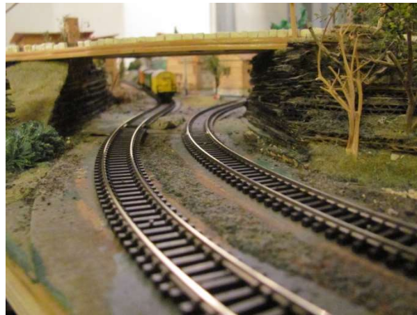
Před odbočením tratě do adamovského Artisanu

Při otvírání této tratě u toho asistovala celá politická a stavební honorace VU a stavbaři z Amezemu. Nutno ještě dodat, že vlaky tudy jezdí bez problémově i nyní. Železničáři Větrnické unie si totiž vzali k srdci rady amezemských kolegů o pravidelném pročišťování kolejí i mašinek.