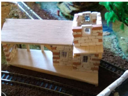
Rozestavěné nádraží v Juliánově (JL)

Větrníčtí stavitelé a někteří turisté měli poprvé možnost shlédnout rošfórské mořské tekreační středisko Mariana Beach. Dokonalá příroda, chladivé a zároveň proteplené písčité pobřeží, mrakodrapy se svými osvětlenými bazény,...to vše doslova vyrazilo dech mnohým Větrníčákům. Zejména byli ohromeni dokonalými omítkami mrakodrapů, osvětlovací technikou a nádhernými skalními partiemi týčícími se nad malebným pobřežím.