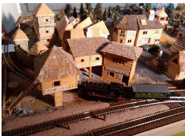
Nová sypaná nástupiště ve Větrníkově

Dalším želízkiem v ohni bude tradičně sjezd a oba slalomy. Pokud se však her zúčastní i Adamov, tak šance VU poněkud klesají (A Adamov vážně pomýšlí na účast na ZOH!). Větrníčtí sportovci se také chtějí zaměřit na trénink nasedání do bobů a vrátit tak nepříjemnou prohru na II. ZOH 2015 v Hollószikle Langaře.