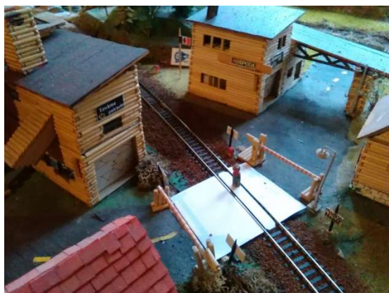
Nový železniční přejezd mezi Adamovem a Juliánovem

Asi čtrnáct dní hledali větrníci a havrányští myslivci a chovatelé ztracené stádo všech jedenácti iiilandských koní. Nakonec bylo stádo úspěšně nalezeno za Pupíkovem.