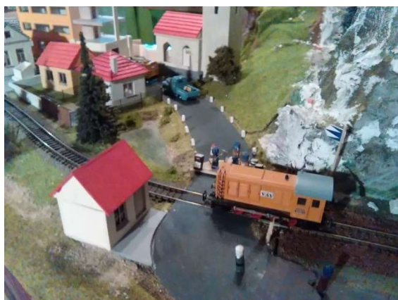
Otevření železnice M. Beach - L. Mulardoch

Odborníci z Amezemu zapojují v dnešních dnech vyhýbkové přestavníky ve Větrníkově, v Gondole a Newcastleu. Tato inovace bude znamenat velké zmodernizování železnice v iilandu. Hlavně se tím zrychlí spojení mezi Mariana Beach a Gondolským metrem. Na této trati bude jezdit Superexpres Margon, který bude stavět, kromě výchozí a konečné stanice, pouze ve Větrníkově, Avandivu a Lúthieniu.