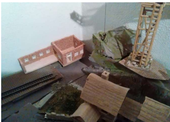
Nádraží v Sharlroa - výstavba