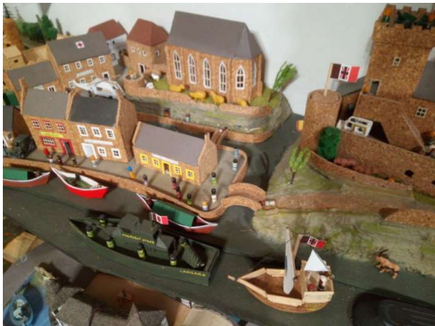
V Kryspachu to žije...

Naše vláda se domnívá, že možná otěhotněl bůh Mon Ferera, jinak si to nedovedeme vysvětlit. Vyzýváme v tomto případě dvě země, o kterých si myslíme, že by mohly za Mon Ferero v nynější politické situaci zaskočit. A především bychom si přáli, aby Skogomadra přehodnotila svůj odmítavý postoj k olympijským ideálům.