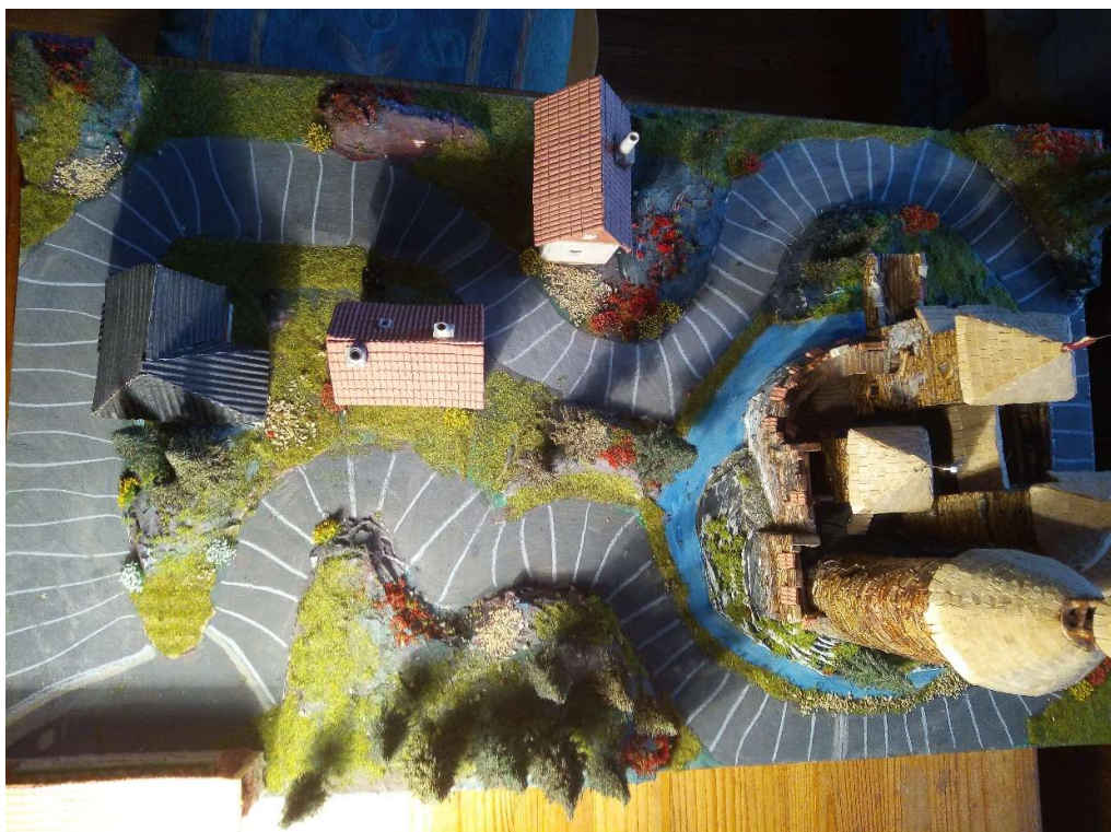
Trat' marathonu a štafetového běhu v Kateřinském království - start a cíl vlevo dole...