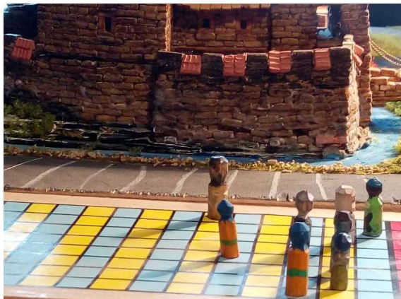
Začátek sprintu se nevyvedl...jako hlemýždi...

K tomu není co dodat. Snad jen rčení: “Těžko na cvičišti, lehký v boji”.