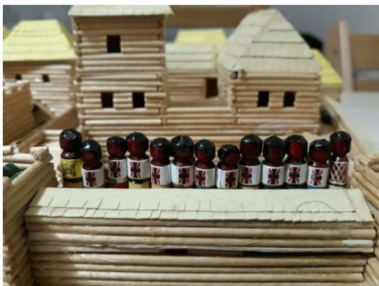
Langarští fotbalisté chtějí obhájit zlato

Langara mile překvapila všechny příznivce sportu a OH, když vypracovala a rozeslala svoji olympijskou prezentaci v power pointu. Je vidět, že se langarští sportovci na LOH v Kateřině těší. Zvláště po loňské absenci. Celosvětovému sportu to jistě prospěje. Naši sportovci však pevně doufají, že tentokrát Langaru v počtu získaných medailí zastíní. A to se týká i fotbalu. Větrnická unie přijíždí na LOH s týmem, který před léty v Rošfórské říši vybojoval bronzové madaile a mimo jiné, slavně porazil i Skogomadru.