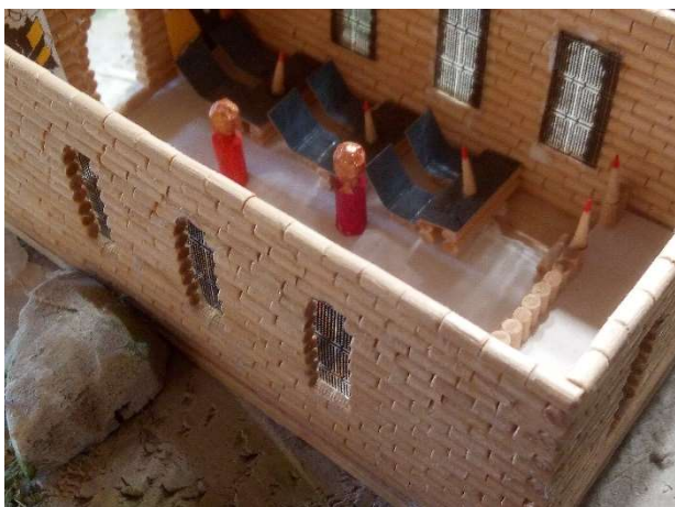
Havrányští inženýři v útrokách Pětikostelí

Pravděpodobně nic. Krajina bude postupně zvelebována a povedou v ní turistické značky.