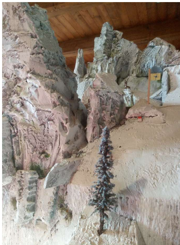
Zleva: Soví věž, Ege di Midi, Ounasvaara, Otorten

Ounasvaara (VU).....6530 m.n.m. Otorten (VU).....6052 m.n.m. Ege di Midi (VU).....5821 m.n.m. Soví věž (SO = HA).....5722 m.n.m. Elwingen (VU) .....5450 m.n.m. Ganek (VU).....5050 m.n.m.