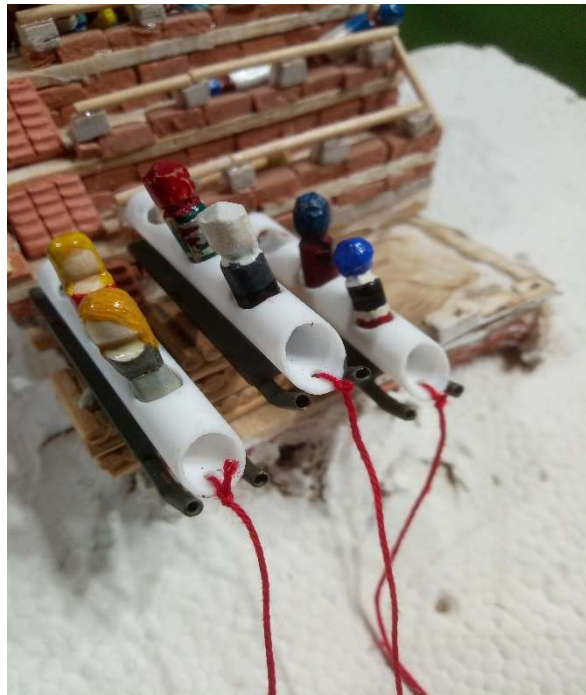
Panáčky iilandu - ženy a muži

Kuba Kubikula (poslanec, min. zahr. věcí VU)