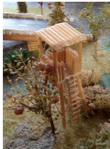
Posed v Juliánově

Jihozápadní provincie: Westdownland (centrum federace)