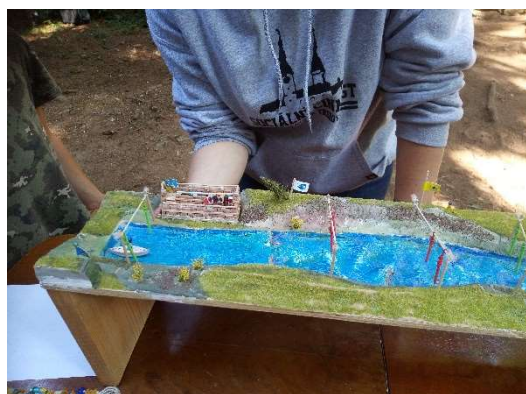
Z přípravy - divoká voda

Občané Větrnické unie jsou již netrpěliví, zdali se přece jenom zorganizuje zimní olympiáda v Rošfórské říši. Podle posledního setkání sportovců v Kateřinském království se domníváme, že bylo olympijské žezlo předáno právě do Patricie, tj. do hlavního města Rošfórské říše. A tam byla olympiáda vždy kvalitní. A nyní má být poprvé zimní v Jižní galaxii.