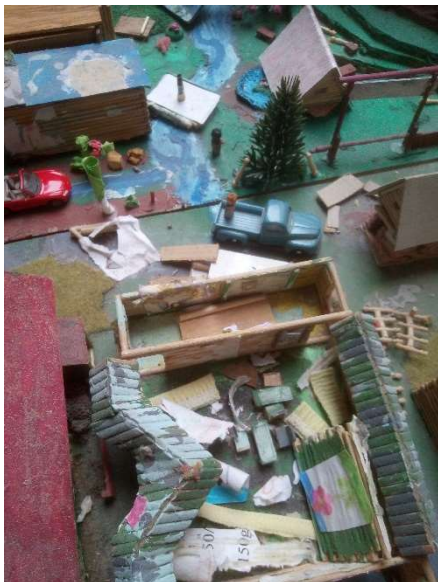
Zničené rozvojové země

Vláda Větrnické unie v minulých tří letech silně podporovala vznik nových států v galaxii BOH, kde byla naděje na vznik nových státních útvarů. Byly tam převezeny některé starší stavby a rovněž i stavby s velikou historickou hodnotou. To se týkalo např. i objektu zahradní restaurace s galerií sovovských mistrů, která byla vypodobněna na starých větrnických bankovkách. Také jsme sem převezli například bazén původně sídlící v našem hlavním městě Gondole.