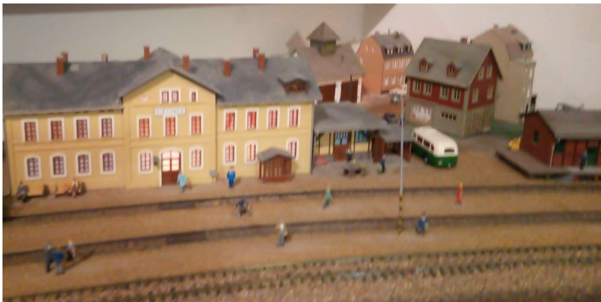
Amezem - na mírně rozmazaném snímku postávají roboti...

bez portfeje VU. Tento světelný park by měl být realizován zejména v regionu Sharlroa. V této části iilandu není příliš mnoho světla, lidé tam většinou svítí petrolejkami, které smrdí a ještě hrozí zvýšená možnost požáru.