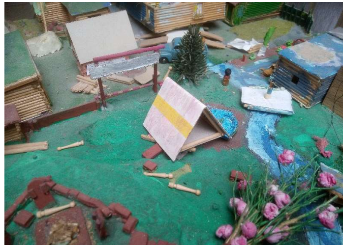
Větrnická delegace obhlíží zničený terén

Jaké však bylo zklamání, když nám bylo vše nedávno vráceno zpět. Je smutné, když si některé země nevěží své historie. Považujeme to však i za chybu místních bohů. Z historie známe tzv. Dakkarský masakr. Před mnoha a mnoha lety poručil jeden starý bůh v galaxii VPP svému synovi zabetonovat panáčky vznikajícího dakkarského státu do dlažby vesnického dvora s tím, že mladý bůh už je taky starý, a tak už si nemůže hrát!