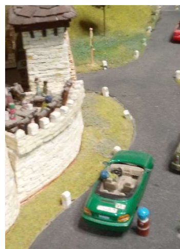
Agent L. 01 vpravo dole...

„Musíme čekat, až se onen člověk pohne a třeba spadne na naše území. Potom ho budeme moci vyšetřit. Ne zdravotně, ale policejně, to dá rozum“ podotkl Kuba Kubikula, bezúhonný občan VU.