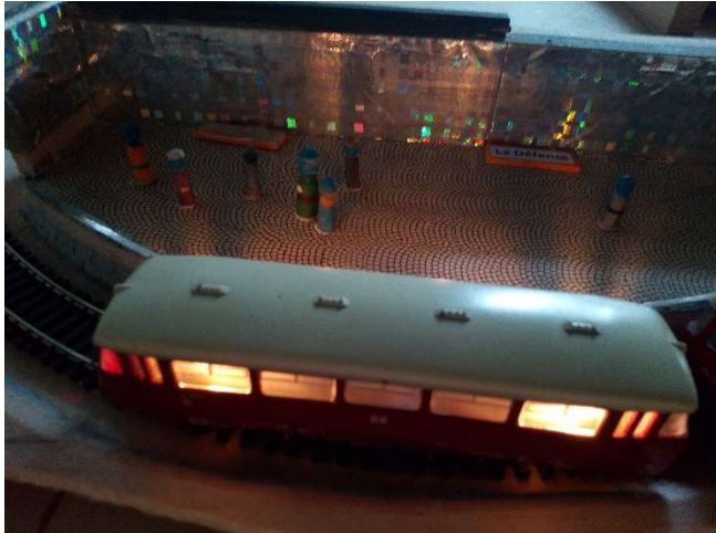
Metro v zastávce La Défence - Gondola

Dlouho zvažovaný podzemní úklid jediného a stále fungujícího metra v Gondole dospěl do finále. Metro spolehlivě jezdí a cestující obdivují čisté a osvětlené prostory všech 4 stanic. Kvarteto těchto zastávek však bude v nejbližší době rozšířeno ještě o pátou. Ke stanicím O'Brienova, 10. prachopadu, La Défense a Elizabeth přibude brzy stanice Červenověžská. Nádraží je již rozestavěno a bude konečnou a zároveň i přestupní stanicí na cestě