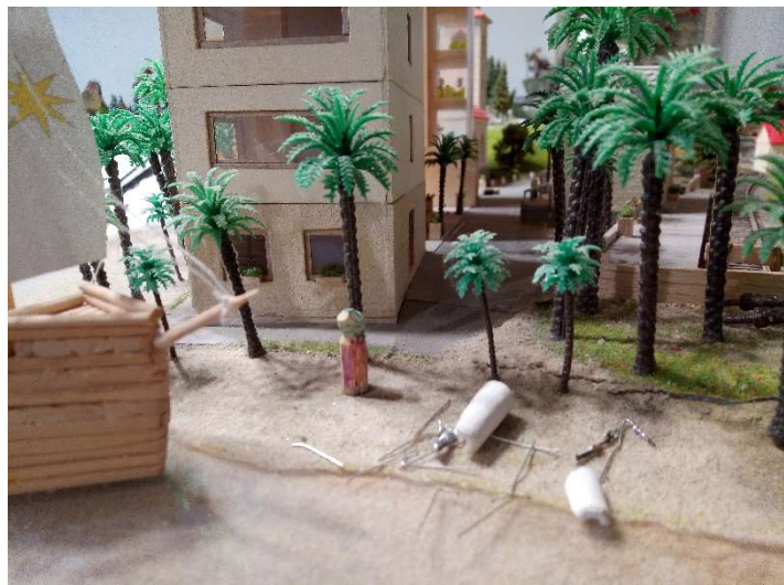
Svinčík v Marianna Beach...