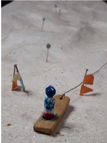
Bingo Biloba se spouští se svahu...

dalších závodníků. V prvním kole skončili např. i Molly Čiperka z Havránye, Nora Bagit z VU i Ikea Korpus z Kateřinského Království.